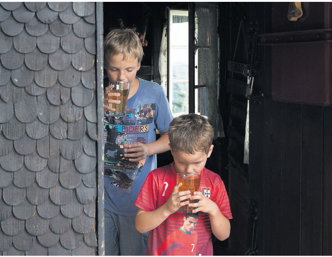
In der Teehütte zur steilen Wand gibt es Most und Tee für durstige Wanderer. Etwas weiter unten feiert der Alpenclub Felsenkammer vor der eindrucklichen Kulisse der Fallätsche.

Verspieltes Gegenüber für Hermann Hallers Skulpturen Seite 15